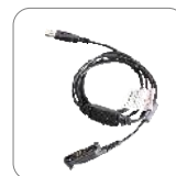
Cable de programación PC155