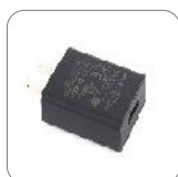
Adaptador (USB) PS2023