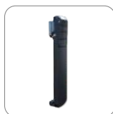
Clip para el cinturón BC48