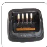
Cargador rápido MUC CH10A07