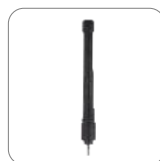
Antena VHF 146-174MHz AN0160H19