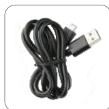
Cable de datos PC143