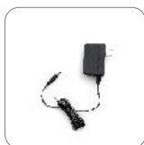
Adaptador de energía 12 V/1 A PS1016