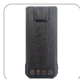
Batería de Li-ion 1500 mAh BL1507