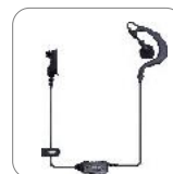
Auriculares tipo C EHN36 EH35