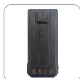
Batería 2200mAh BL2204